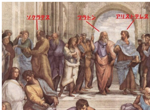
出典:「哲学の殿堂—ソクラテス・プラトン・アリストテレス」荻野博之著 (NHKライブラリー)